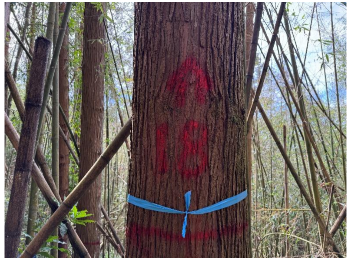
編號 18 樹種 杉木