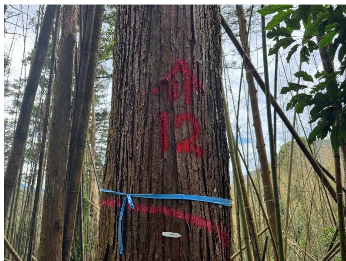
編號 12 樹種 杉木