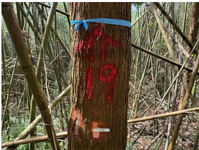
編號 19 樹種 杉木