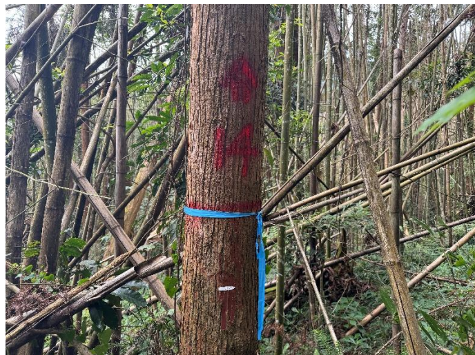
編號 14 樹種 杉木