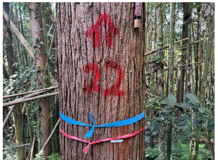
編號 22 樹種 杉木