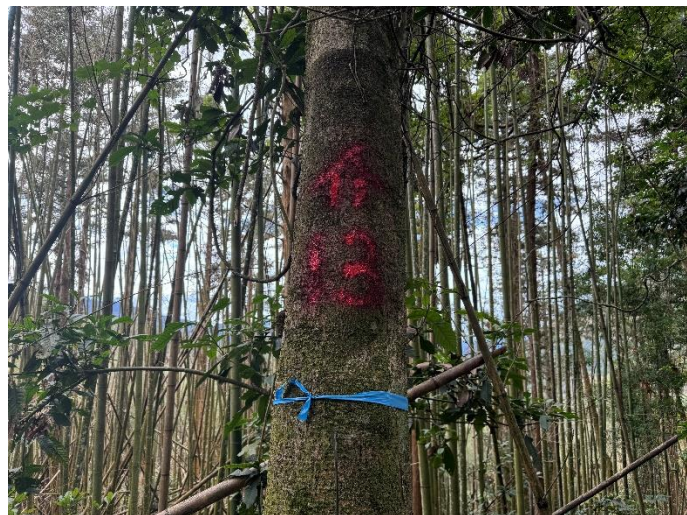
編號 13 樹種 雜木