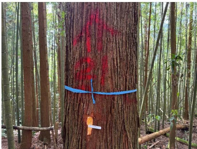
編號 21 樹種 杉木