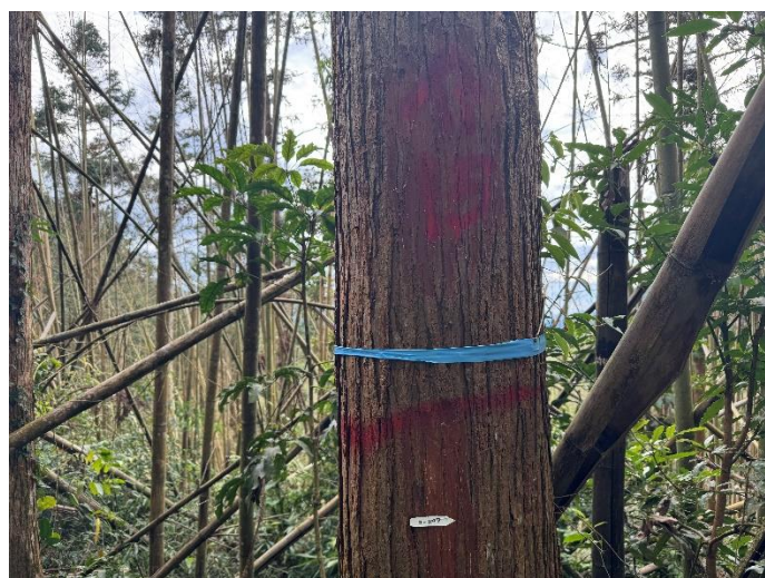
編號 15 樹種 杉木