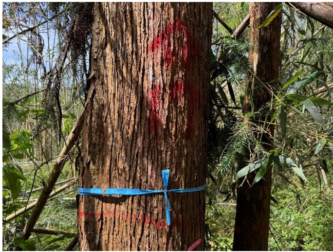
編號 17 樹種 杉木