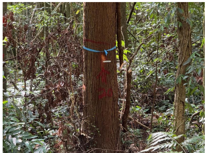
編號 20 樹種 杉木