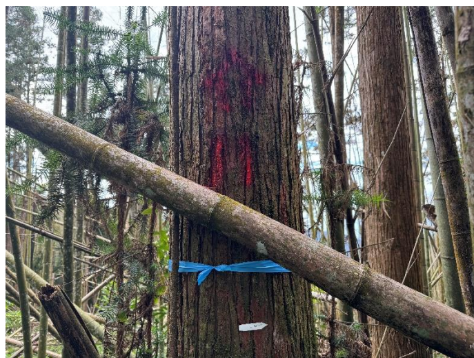
編號 11 樹種 杉木