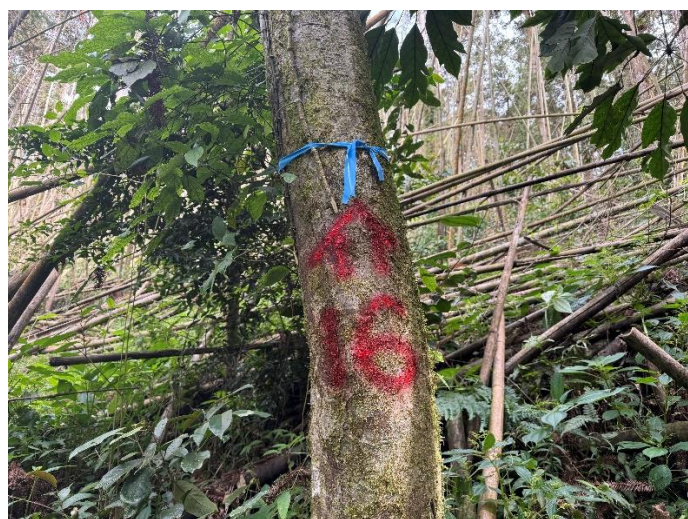
編號 16 樹種 雜木