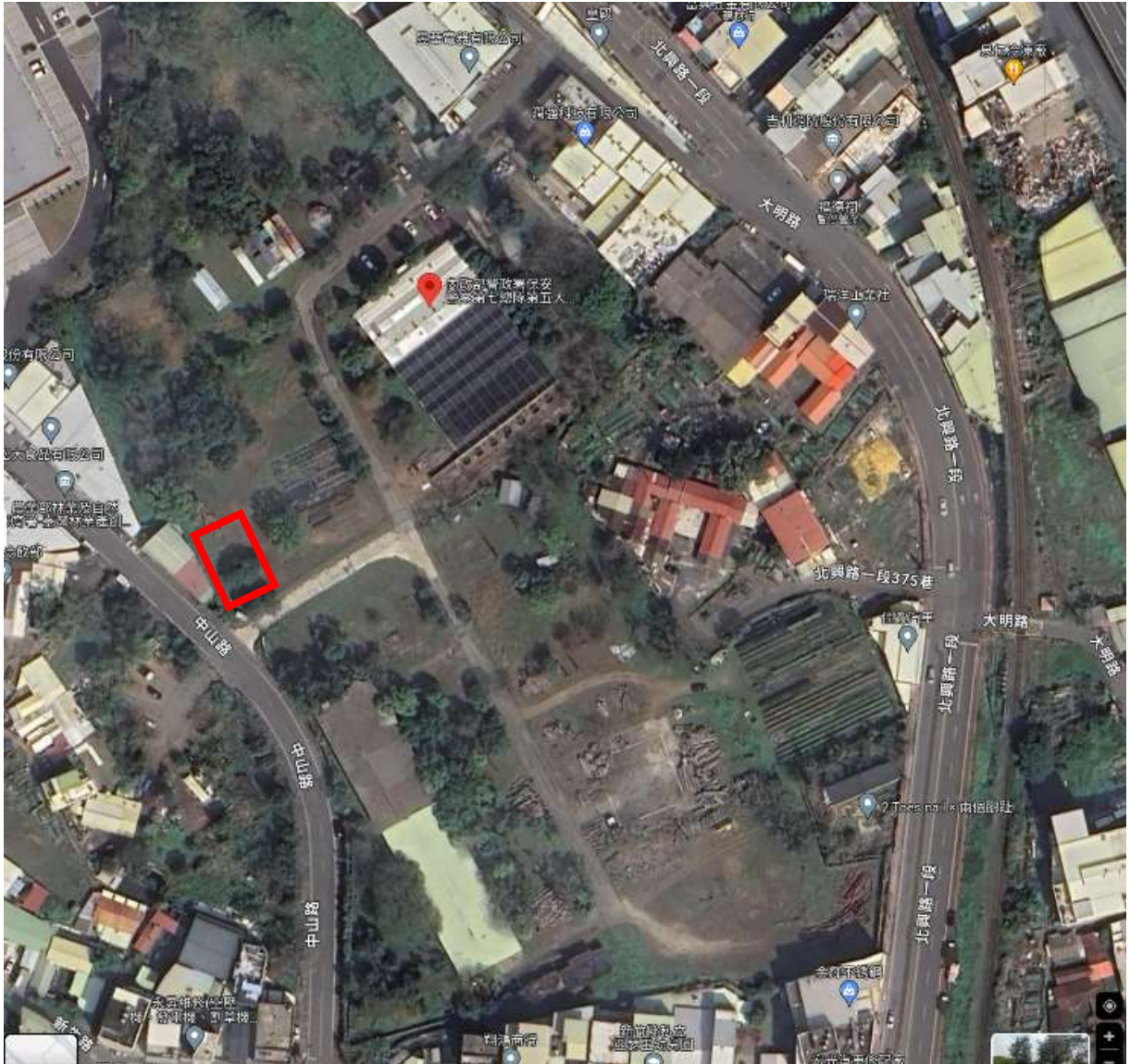
地點：新竹分署竹東貯木場