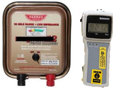
圖二、左：(直流電)電牧器(輸入電源：DC12V(汽車電瓶)；有效長度50公里；輸出電壓：9.5KV；輸出功率：1.5焦耳；使用注意事項：(1)須安裝接地線(避免雷擊損毀)；(2)接電時應做好導線絕緣措施；(3)使用電壓檢測器量測電瓶電壓；(4)不可直接置於戶外任風吹雨淋；(5)農地較不適合使用太陽能型電牧器；(6)要經常巡查有無異物在電牧導線上避免漏電。)；右：電壓檢測器