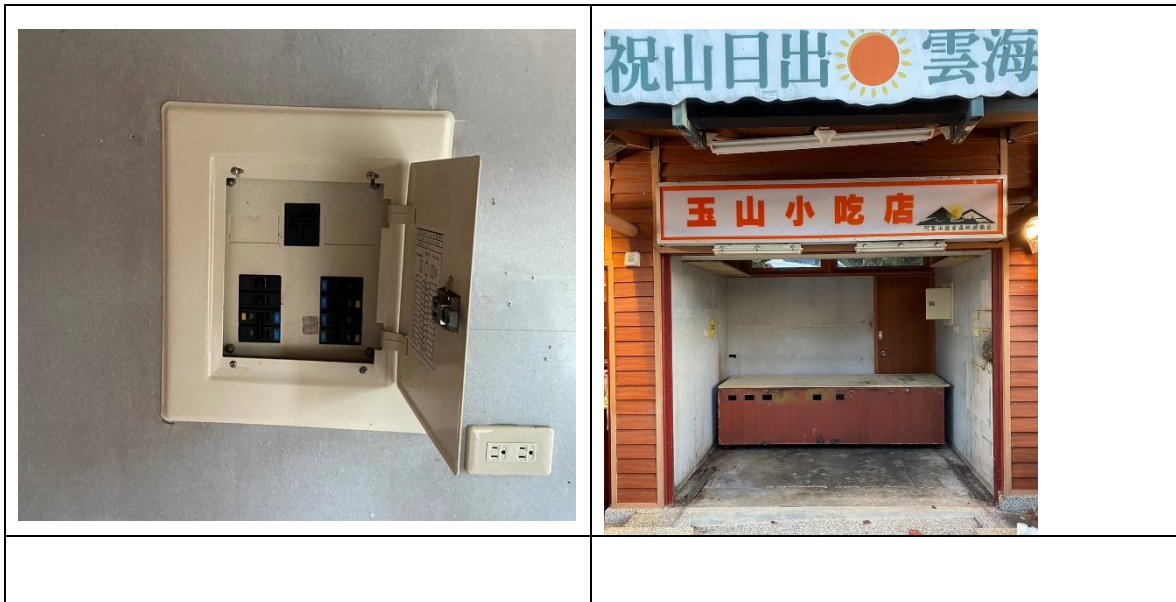
阿里山國家森林遊樂區香林、祝山服務區賣店建物相關設施