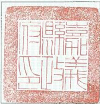
本執照應加蓋主管機關印信後始得生效